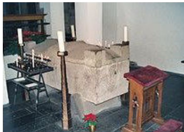
Romiešu sarkofāgs satur Alberta Lielā relikvijas, kas atrodas kapenēs Sv. Andreja baznīcā Ķelnē, Vācijā.

Bīskapa pienākumus pildot, Alberts nepārtraukti ir ilgojies pēc klostera celles klusuma, tāpēc arī juties īpaši laimīgs, kad pēc īsa laika pāvests viņam ir atļāvis nolikt bīskapa zīgli un no jauna pievērsties zinātniskajam darbam, kaut