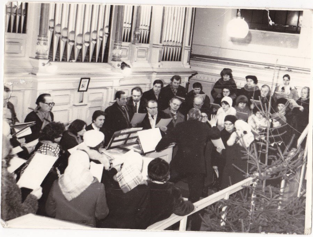
1977.g.26.decembris kora 50.gadadienu atzīmējot.